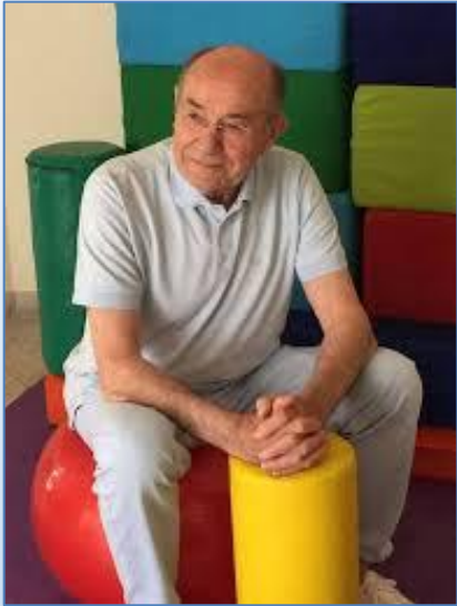
B.AUCOUTURIER : psicomotricità educativa